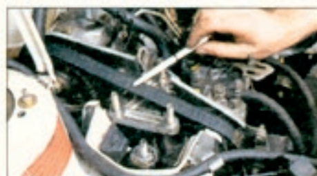
Zu beachten: Wenn der Zahnriemen singende Töne von sich gibt, wird zur Kasse gebeten. Mit Einbau ca. 300 Mark