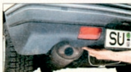
Kurzlebig und teuer: Die besonders gefährdete Plastik-Heckschürze des Peugeot 205 kostet fast 200 Mark

80 000 schreibt Peugeot übrigens generell einen Zahnriemenwechsel vor. Wer also beabsichtigt, einen 205 mit dieser Laufleistung zu erwerben, sollte sich erkundigen, ob diese Wartungsarbeit auch bereits ausgeführt wurde.