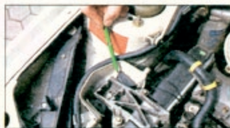
Diesel-Problem: klopfende Geräusche im Motorraum durch weich gewordene Gummilager. Teile und Einbaukosten ca. 200 Mark

Geräusche trieben viele Besitzer unruhig in die Werkstatt. Ein Neuteil von besserer Qualität und sorgfältiges Spannen schafften Abhilfe. Mit Kosten von 300 Mark muß der Kunde dabei aber rechnen. Bei einem Kilometerstand von rund