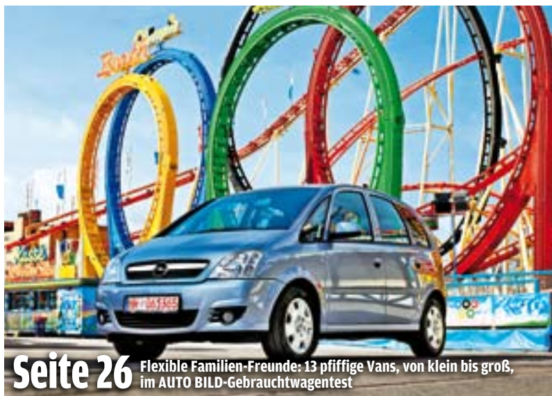
Seite 26 Flexible Familien-Freunde: 13 piffige Vans, von klein bis groß, im AUTO BILD-Gebrauchtwagentest