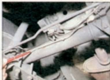
Typische Capri-Schwachstelle: Die Bremsleitungen auf der starren Hinterachse rosten besonders gern. Der Austausch kostet ca. 100 Mark

Das beste Getriebe hält auf Dauer nicht, wenn es permanent vergewaltigt wird. Und viele, vor allem jüngere, Capri-Fahrer gehen mit ihrem Sportwagen nicht zimperlich um. Hören Sie deshalb bei der Probefahrt genau hin, ob das Getriebe bereits erste Anzeichen von Mahlergeräuschen von sich gibt. Denn das signalisiert in der Schaltbox einen aufkommenden Lagerschaden. Knackt es hingegen beim Anfahren im Gebälk des Hinterwagens, hat dies meist eine andere Ursache. Denn eine Schwachstelle sind beim Capri die Silentbuchsenlager an den Längslenkern der Hinterachse sowie des Stabilisators. Je nach Fahrweise schlagen dort die Gummielemente oft schon nach 75 000 Kilometern aus. Überprüfen läßt sich das am besten durch ruckartiges Beschleunigen und Gaswegnehmen.