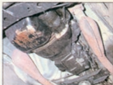
Wird beim TÜV häufig bemängelt: Ölverlust durch undichte Simmerringe an Motor und Getriebe. Die Reparatur ist aufwendig: bis zu 300 Mark