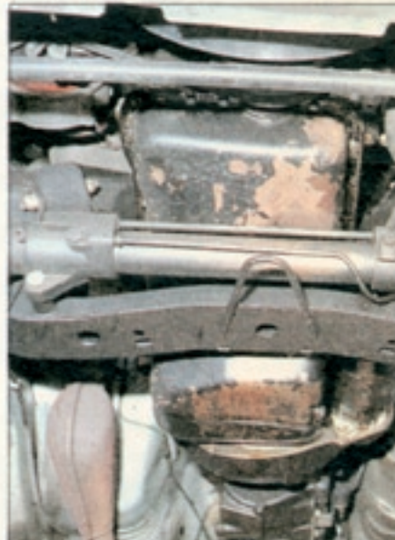
Die Lenkgetriebe des Ford Capri haben oft schon nach 40 000 Kilometern zuviel Spiel. Die Reparatur ist nicht billig: Kosten bis zu 900 Mark

Aber auch mit der Qualität der vorderen Radaufhängung ist es nicht zum besten bestellt. Hier verschleiben besonders gern die Buchsen an den vorderen Querlenkern. Dies sollte man vor dem Kauf eines älteren Capri von einem Fachmann überprüfen lassen. Am besten mit dem Fahrzeug beim TÜV vorfahren. Dort wird man Ihnen dann auch sagen können, ob die Lenkung und die