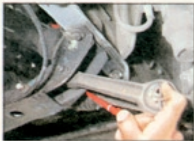
Die Drehpunkte der vorderen Querlenker zählen nicht zur robusten Sorte. Die Reparatur kostet einschließlich Achsvermessung ca. 270 Mark