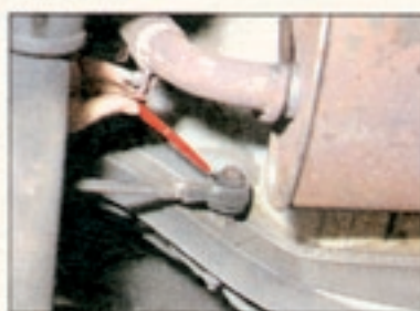
Klappergeräusche an der Hinterachse haben beim Capri meist ihre Ursache in ausgeschlagenen Längslenkern und Stabis. Kosten: bis zu 250 Mark

Zahnriemen vom Nockenwellenantrieb alle 40 000 Kilometer zu erneuern. Sonst läuft man bei diesen Modellen Gefahr, unfreiwillig und oftmals unpassend auf großer Fahrt liegenzubleiben.