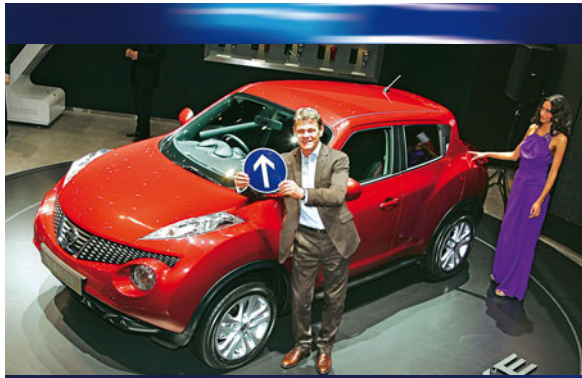
18 GENFER SALON Die große Show der Auto-Neuheiten 2010: Wir zeigen sie alle live von der Messe

► Das komplette Genf-Paket im Internet: autobild.de liefert Live-Berichte aus den Messehallen des Genfer Salons, jede Menge Bilder, exklusive Videos. Jetzt reinklicken auf www.autobild.de/genf