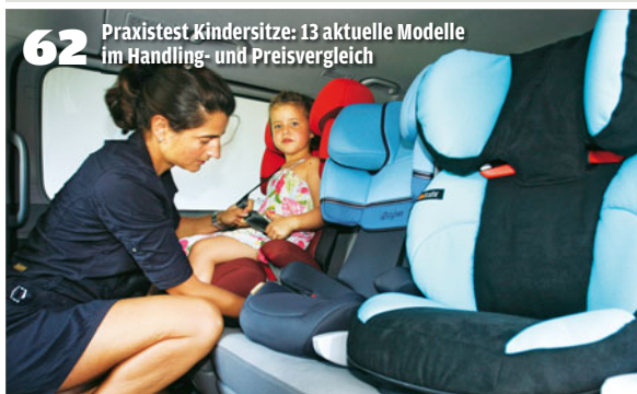
62 Praxistest Kindersitze: 13 aktuelle Modelle im Handling- und Preisvergleich