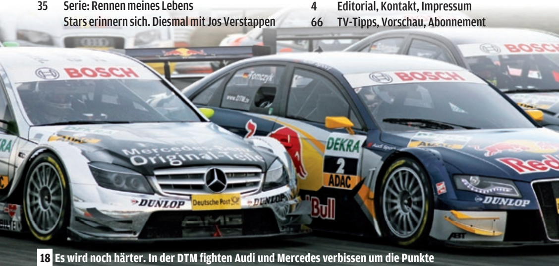
18 Es wird noch härter. In der DTM fighten Audi und Mercedes verbissen um die Punkte

Auto Bild .de Im Online-Archiv von AUTO BILD www.autobild.de MOTORSPORT gibt es News, Videos und die besten Storys: www.autobild-motorsport.de