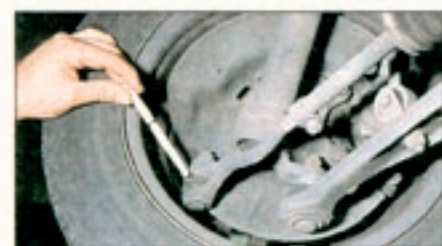
Achten Sie auf zu großes Spiel in der Lenkung. Der TÜV beanstandet beim Dreier häufig ausgeschlagene Kugelköpfe – ca. 300 Mark