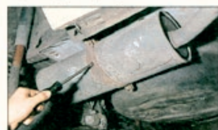
Die Auspuffanlage hält beim kleinen BMW selten länger als zwei Jahre. Neue Schalldämpfer sind nicht billig – ca. 600 bis 1000 Mark