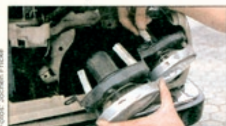
Die Scheinwerfer-Reflektoren der kleinen BMW-Modelle ermatten frühzeitig und verlieren dann an Leuchtkraft – ca. 300 Mark