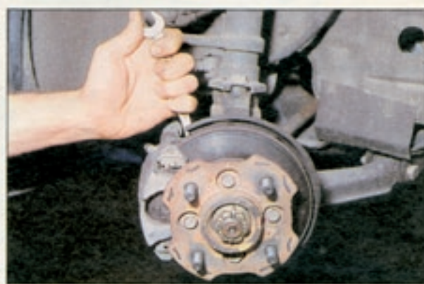
Cuore-Bremsscheiben verschleifen schnell. Kosten 250 Mark