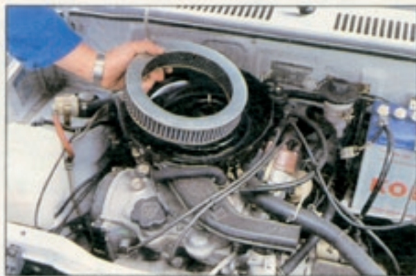
Cuore-Motoren reagieren auf vergessene Inspektionen empfindlich