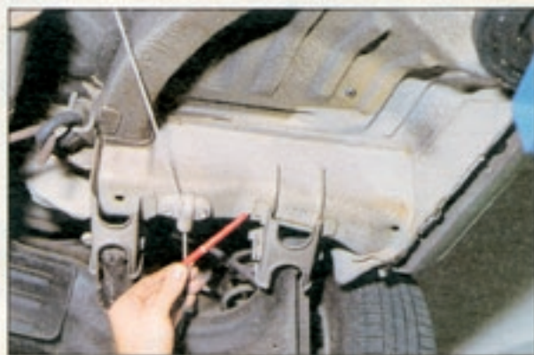
Cuore-Blechfalze sind nur unzureichend gegen Rost geschützt