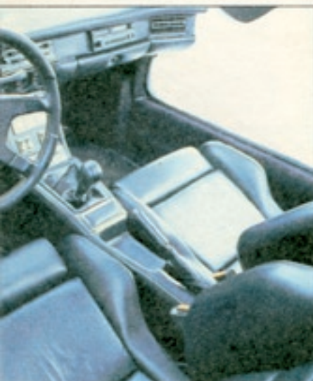
sten sportlichen Ansprüchen. Der rote Knopf betätigt die Sicherheitsmechanik der Türen