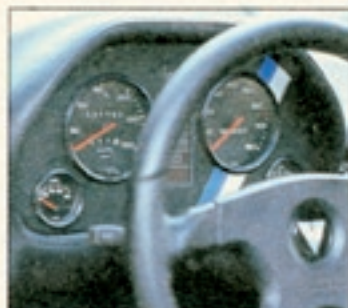
Schöne, aber halb verdeckte Instrumente. Die Tachonadel taucht erst bei 220 km/h wieder im Blickfeld auf

Ein Druck auf den Blip – und die beiden Flügeltüren öffnen fast lautlos den Weg ins Innere. Sie schwingen nicht zur Seite wie beim berühmten Mercedes 300 SL Gullwing und auch nicht nach vorn wie beim fast so berühmten Lamborghini Countach, sondern schräg nach vorn. Das hat der Zender-eigenen Entwicklung die ungetüme, aber treffende Bezeichnung „Schrägschwing-Flügeltüren“ eingetragen. Sie