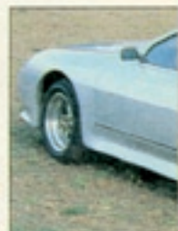
Das kunstvolle Windleitwerk er-

ist ein Luxus, der bei dieser Kreation auch überflüssig wäre. Ich freue mich über den einen Zentimeter Kopffreiheit, der mir verbleibt, nachdem sich die Türen zugesaugt haben, genieße die bullige Kraft des Motors, die das Auto vehement nach vorne treibt, und ignoriere die Beharrlichkeit, mit der die Pirelli-Walzen (285/40-15) jeder Spurrille auf der Autobahn hinterherlaufen wollen.