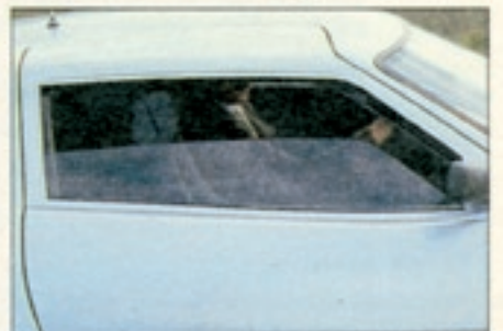
Die Seitenscheiben lassen sich nur halb versenken. Die starke Wölbung in den Türen läßt nicht zu, daß sie völlig verschwinden