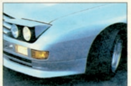
Schlafaugen neben dem breiten Kühlergrill. Die Halogen-Doppelscheinwerfer des Vision werden elektrisch ein- und ausgefahren