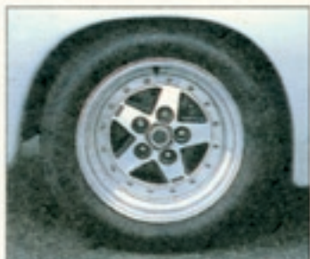
Die 265er-Walzen des Vision IS stammen von Pirelli, die 15-Zoll-Leichtmetallräder von Zender

sich so leicht überwinden. Meine Hand, die den Innen Spiegel justieren will, greift ins Leere. Es gibt keinen. Er wäre auch sinnlos. Das einzige, was mir der Vision nach hinten gewährt, ist ein Blick auf sein sanft ansteigendes Heck mit dem ausgeklügelten Windleitwerk, das den Anpreßdruck an der Hinterachse erhöht. Ich suche die elektrische Verstellung der Außenspiegel – Fehlanzeige. Die zwei kleinen Elektromotoren wären überflüssiges Gewicht für die Türhydraulik gewesen. Also fahre ich die Fenster runter, und die bleiben auf halber Strecke stecken. Die Wölbung der Tür versperrt den weiteren Weg. Durch den Spalt fummle ich mir die Spiegel zurecht und drehe den Zündschlüssel. Blubbernd erwacht der Audi-Fünfzylinder unter der langen Schnauze. Der technische Unterbau der Zenderschen Vision stammt komplett vom Audi quattro – Motor, Fahrwerk und Allradantrieb – und wurde nur leicht modifiziert. Mit einer anderen Nockenwelle und vergrößerten Ein- und Auslaß-