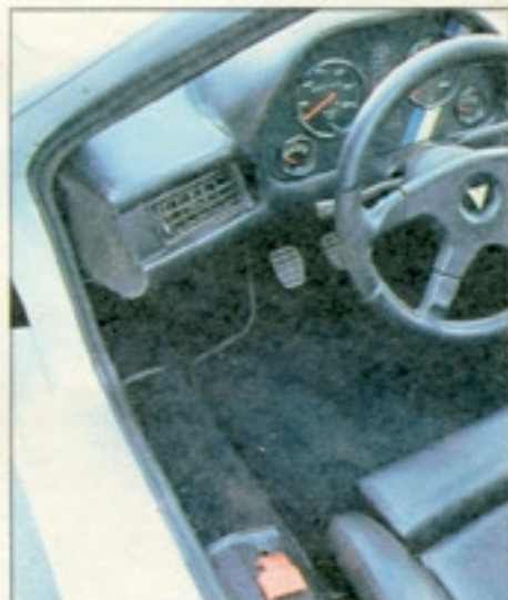
Leder im Innenraum, wohin der Blick auch fällt. Die Recaro-Sitze genügen auch höch-